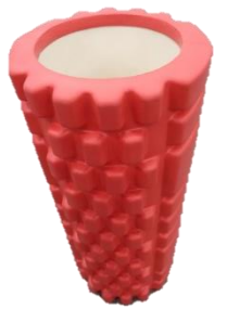
↑ グリットローラー