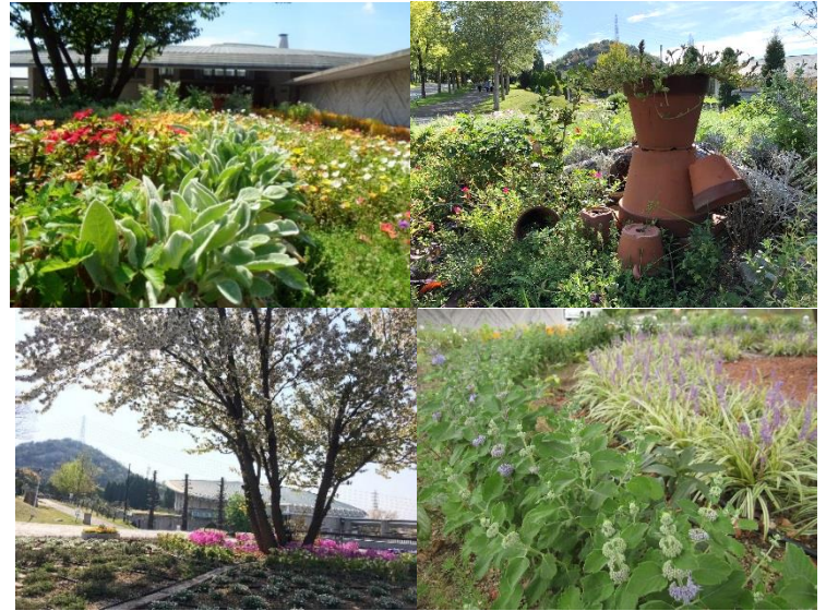
左上：ハーブなどの花々、右上：植木鉢をアレンジしたスタッフの遊び心 左下：4月頃に咲くヤマザクラ、右下：ヤマザクラの回りを取り囲む

改修工事をするにあたり庭園管理のスタッフと何度も話し合いを重ね、花壇がより賑やかになるように、そして花壇の手入れがしやすくなるように生まれ変わることができました。現在では、庭園管理のスタッフがさらにアレンジを加え、今ではウェルネスパークの顔となっています。