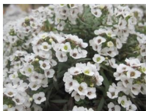
スーパーアリッサム