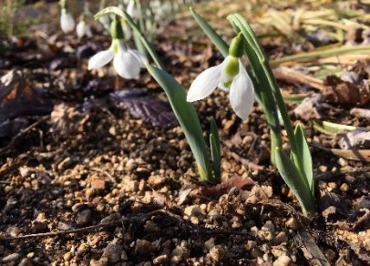
↑スノードロップ (2月上旬にウェルネスガーデンで咲きます) ウメ →

木々が芽吹く前のこの季節は、足元や目よりも高い木々の花がひっそりと咲いています。