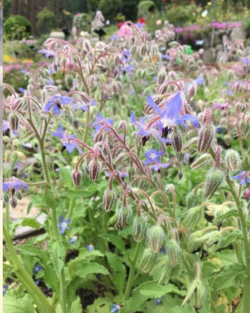
↑ポリジのアイスクューブ (花びらを氷の中に閉じ込める)

ムラサキ科 ポリジ → ポリジの花は、サラダやケーキの飾りつけとしても楽しめます。